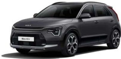
Interstellar Grau Metallic (AGT)