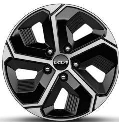
16-Zoll-Leichtmetallfelgen (Serie für Core und Vision)

Bei einigen unserer modernen Metallicfarben werden bewusst unterschiedliche Farbpigmente verwendet. Dadurch können unter bestimmten Lichtverhältnissen, z. B. direktes Sonnenlicht, attraktive Farbeffekte erzielt werden. Zum Teil kann die Farbe changieren, z. B. von Schwarz zu Dunkelblau. Bei den hier abgebildeten Farbdarstellungen kann es aufgrund der Drucktechnik zu Abweichungen zu den Originalfarben kommen. Weitere Informationen zu den Farbeffekten und Grundfarben erhältst du bei deinem Kia-Partner. Metalllackierungen sind aufpreispflichtig.