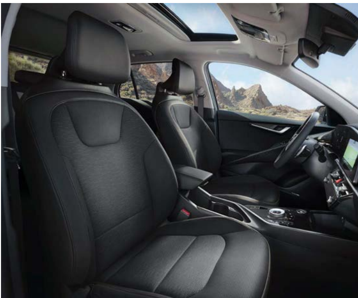
Sitzbezüge in hochwertiger Ledernachbildung, Charcoal (CCV) (Spirit)