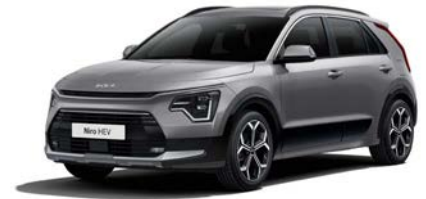
Stahlgrau Metallic (KLG)