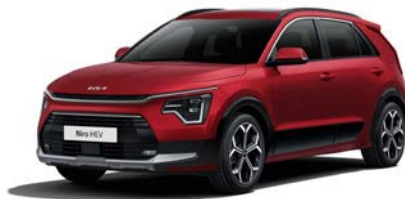
Runway Rot Metallic (CR5)

Bei einigen unserer modernen Metallicfarben werden bewusst unterschiedliche Farbpigmente verwendet. Dadurch können unter bestimmten Lichtverhältnissen, z. B. direktes Sonnenlicht, attraktive Farbeffekte erzielt werden. Zum Teil kann die Farbe changieren, z. B. von Schwarz zu Dunkelblau. Bei den hier abgebildeten Farbdarstellungen kann es aufgrund der Drucktechnik zu Abweichungen zu den Originalfarben kommen. Weitere Informationen zu den Farbeffekten und Grundfarben erhältst du bei deinem Kia-Partner. Metalllackierungen sind aufpreispflichtig.