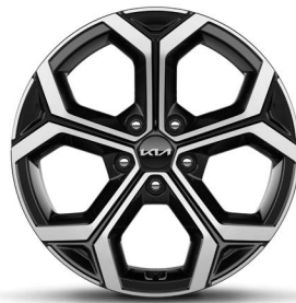
18-Zoll-Leichtmetallfelgen (Serie für Spirit)