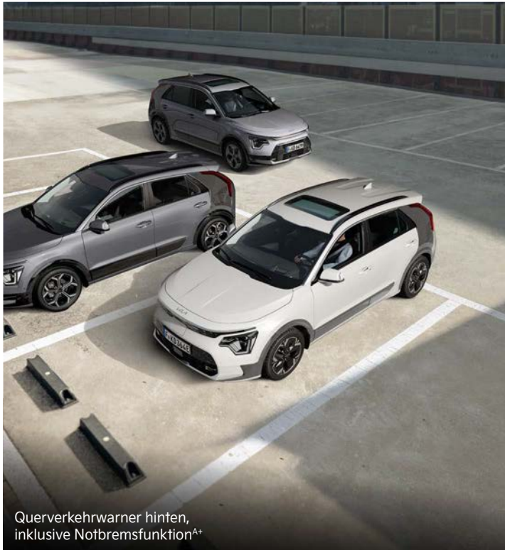
Querverkehrswarner hinten, inklusive Notbremsfunktion A+

Mit einem breiten Spektrum an aktiven Sicherheitssystemen A unterstützt dich der Kia Niro dabei, in Gefahrensituationen schnell und angemessen zu reagieren.