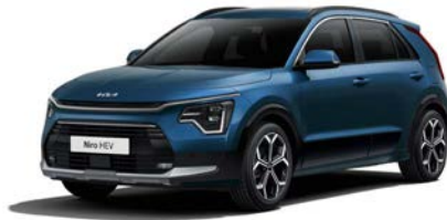
Mineralblau Metallic (M4B)