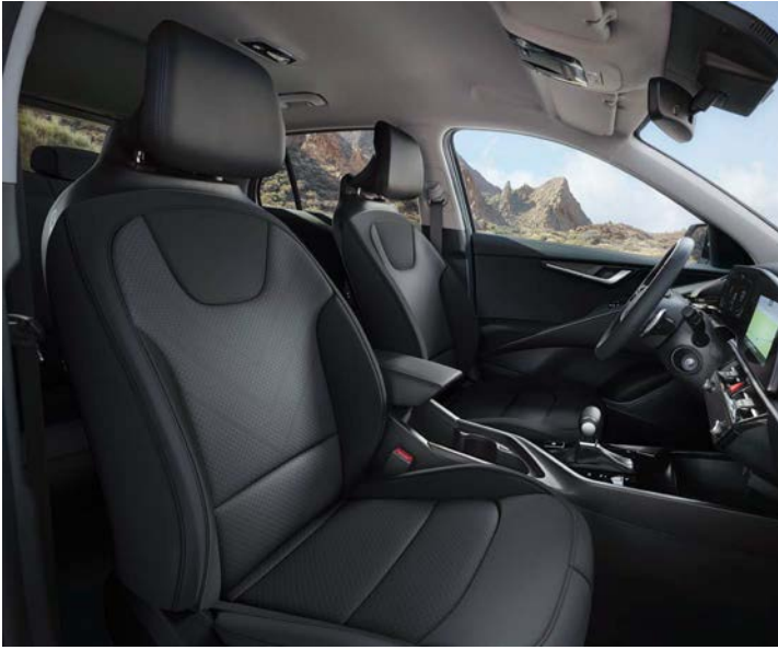
Sitzbezüge in Stoff, Charcoal (CCV) (Core)

Im Innenraum des Kia Niro kommen sorgfältig ausgewählte Materialien zum Einsatz, damit du dich vom ersten Moment an wohlfühlst. Je nach Ausstattungsvariante stehen für die Sitze Bezüge in Stoff, Stoff-Leder-Kombination (mit hochwertiger Ledernachbildung) oder Leder kombiniert mit hochwertiger Ledernachbildung zur Wahl.